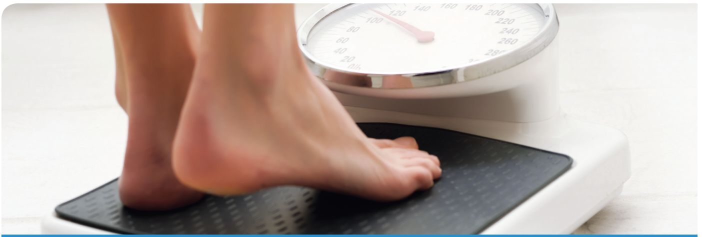
건강한 체중 유지 유청단백질이 포함된 고단백 저칼로리 식단은 지방을 더욱 많이 태우고 순근육량을 늘려 체중 감량의 질을 향상시킨다. 1-9