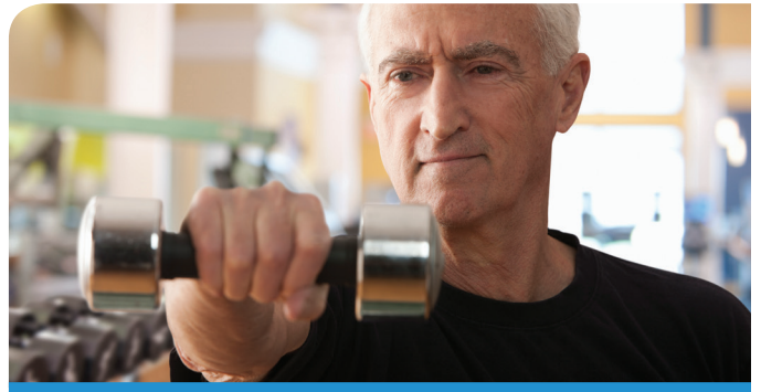
근육 유지 보다 양질의 단백질 섭취와 정기적 운동을 통해 나이가 들어도 근육량을 유지하고 더욱 활력 있는 삶을 영위할 수 있다. 20,21