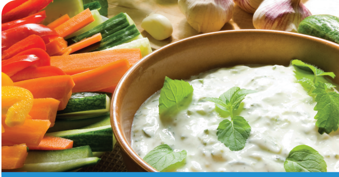
공복감 완화 칼로리를 위한 칼로리. 유청단백질은 탄수화물이나 지방보다 큰 포만감을 오래 느끼도록 돕는다. 10-13