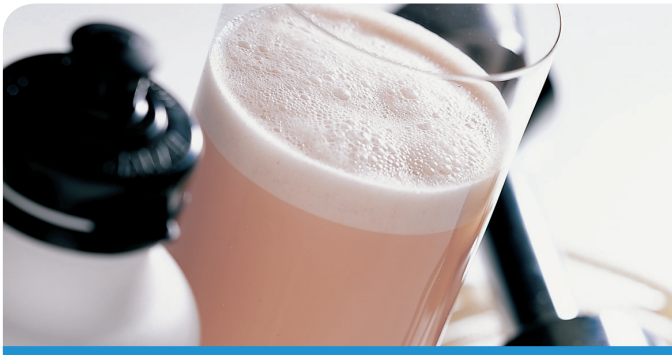
운동 후 회복력 향상 운동할 때 유청단백질을 섭취하면 근육의 생성과 회복에 도움이 된다. 14,26,27