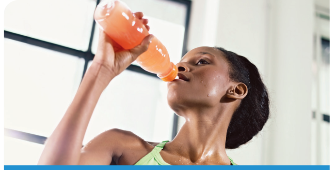
근살 없는 몸매 유청단백질을 섭취하며 정기적으로 저항성 운동을 하는 것이 저항성 트레이닝만 하거나 탄수화물을 섭취하면서 저항성 운동을 하는 것보다 순근육량을 더 많이 늘려준다. 14-19